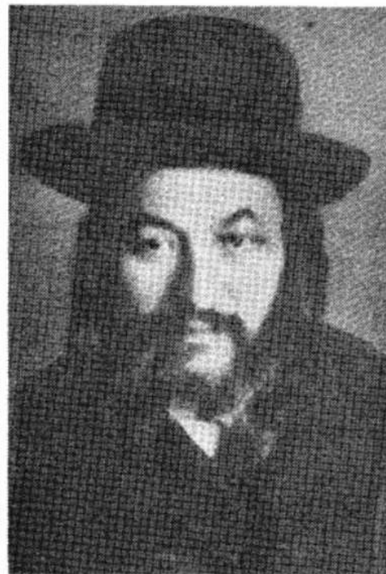
הרה"צ רבי יצחק זעליג מורגנשטרן האדמו"ר מסוקולוב